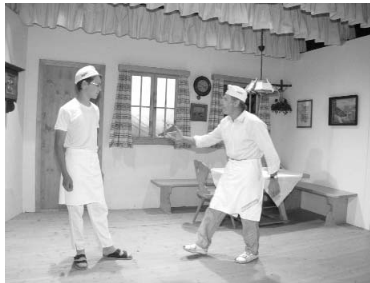
Bäckermeister Sriezel Die Brotbruderschaft, die dieses Theaterstück veranstaltete, hat den Reinerlös Bäckerkollegen in Oberösterreich zukommen lassen, die durch die Hochwasser Katastrophe 2002 ihre Existenz verloren haben.

Brotbruderschaft in Zusammenarbeit mit Industrie und Gewerbe für Lehrmittel sorgen, die den Schulen zur Verfügung gestellt werden und über den volkswirtschaftlichen, gesundheitsbewahrenden und kulturellen Wert des Brotes Auskunft geben. So wird etwa an die Herausgabe einer "Brotfibel" gedacht. Von Zeit zu Zeit trifft sich der Bruderschafts-Vorstand in seinem Vereinslokal. Geplant sind die Verkostung neuer Brot-Kreationen sowie der Vortrag literarischer und musikalischer Beiträge zum Thema Brot.