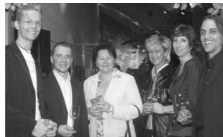
Unter den Gästen waren natürlich auch gut gelaunte Ruetz Mitarbeiter zu finden.